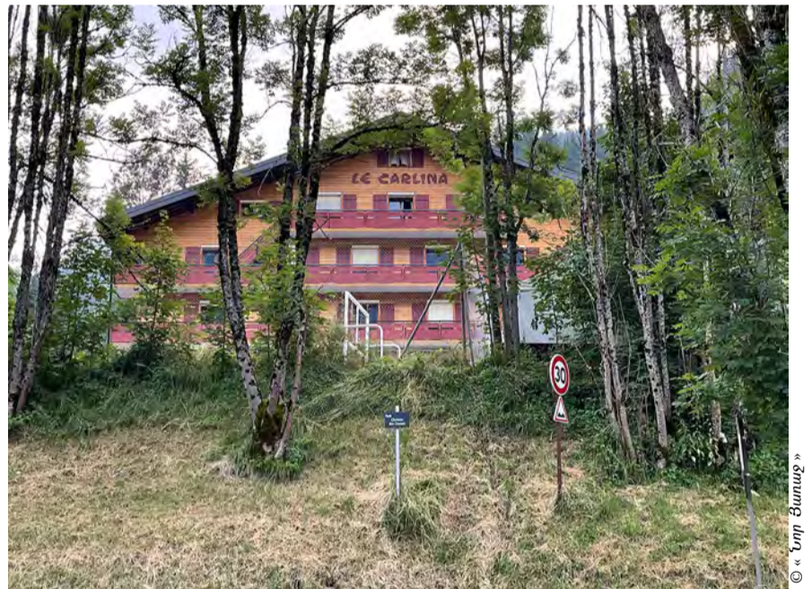
Ճամբարին շէնքը՝ «Լը Գարլինա»

պի տունը: Ուշադրութիւն չես դարձներ փայտեայ արդիական պատշգամներուն, ասֆալթեայ ճամբաներուն, սակայն կը տեսնես գունաւոր ծաղիկներու խնամքով ցանուած փունջերը. պատկերի, գծագրութեան մը պէս կ'երեւի ամէն ինչ: Գծագրութիւն մը, որ կ'ամբողջանայ քանի մը լեռնագագաթներով, կապոյտ երկնքին մէջ ամպիկներու կտորներով եւ իրարու միացող սեւ երկու գծիկներով, որոնք վստահաբար, նկարի մը մէջ, երկինքը զարդարող թռչուններ կը պատկերացնեն: