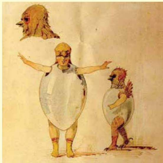
VIKTOR HARTMANN (1834-73), ESTUDO, 1871

O gesto artístico de Ravel revelar-se-ia crucial para dar a conhecer a obra de Mussorgsky num dos seus exemplos mais vívidos e sedutores. E oferece grandiosidade àquele que era o seu sentido simbólico primordial: transportados pela música, à medida que as peças se sucedem, somos guiados através de dez pequeno e deslumbrantes universos.