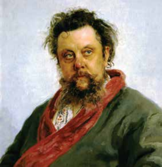
MODEST MUSSORGSKY, POR ILYA REPINE, 1881