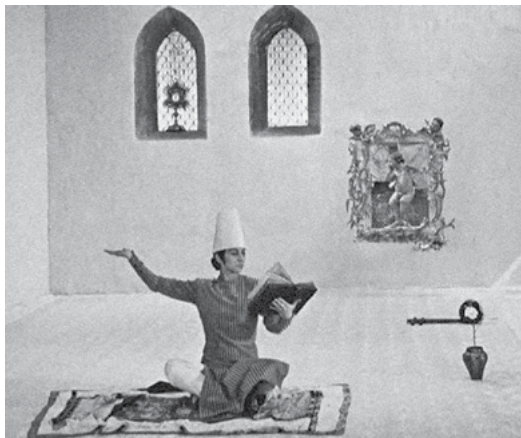
A COR DA ROMA DE SERGUEI PARADJANOV