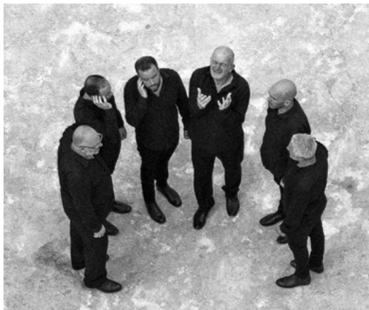
A FILETTA