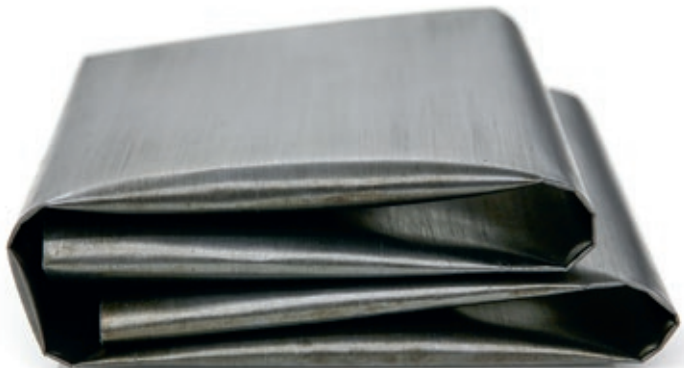
Dobra dobrada, 2012. graphite, papier, toile. Coll. Yvon Lambert.

La délégation en France de la Fondation Calouste Gulbenkian rouvre en début de cette année à deux endroits différents : le Bd Raspail où nous partageons les installations avec la Fondation Maison des Sciences de l'Homme, notre partenaire de longue date ; et la Maison du Portugal à la Cité universitaire, où la Bibliothèque poursuivra la mise à disposition de son fonds auprès des chercheurs et lecteurs concernés par la culture des pays lusophones.