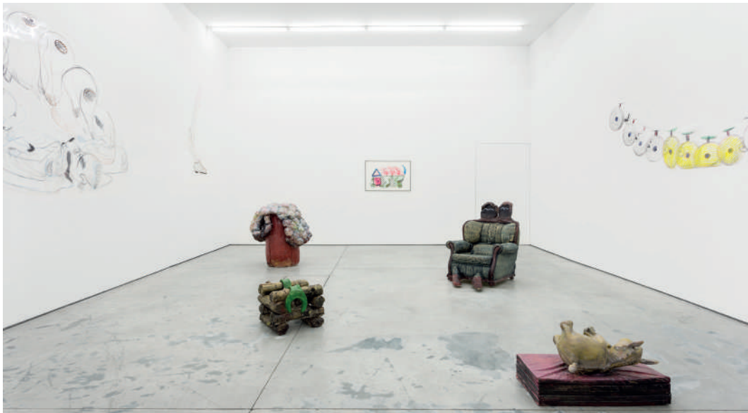
Man with Really Soft Hands, Exhibition view, Solo exhibition Galeria Múrias Centeno, Lisbon, 2017.

LA FONDATION CALOUSTE GULBENKIAN LANCE SA 3 E ÉDITION D'APPEL À PROJETS D'EXPOSITION POUR SOUTENIR L'ART PORTUGAIS DANS LES INSTITUTIONS ARTISTIQUES FRANÇAISES