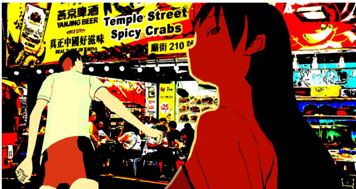
Pedro Neves Marques, WYU, Searching for a Character Between East and West, 2021, Vidéo d'animation couleur, son. Photogramme

LA FONDATION CALOUSTE GULBENKIAN LANCE LA 4 E ÉDITION DE SON APPEL À PROJETS D'EXPOSITIONS POUR SOUTENIR L'ART PORTUGAIS DANS LES INSTITUTIONS ARTISTIQUES FRANÇAISES