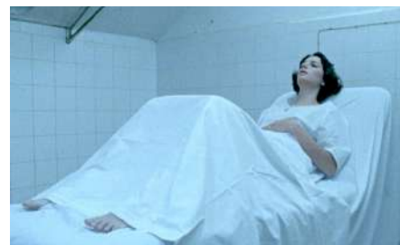
Gabriel Abrantes «A Brief History of Princess X», 2016, Still from 16mm film, Courtesy of the artist.

Conjugant Science, Histoire de l'art, Religion, et savoir liés aux plantes médicinales, cette installation immersive rassemble des supports multiples (vidéo, animation, dessin) et questionne notre rapport à la médecine moderne.