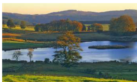
Plateau de Millevaches, étang des Oussines

L'exposition porte sur les problématiques environnementales qui touchent les régions côtières, notamment la pollution liée au plastique et au pétrole. Elle sera accompagnée de conférences et d'ateliers de médiation pour sensibiliser le public. Soucieuse de son empreinte carbone, le transports des oeuvres s'effectuera en voilier de Lisbonne à Brest.