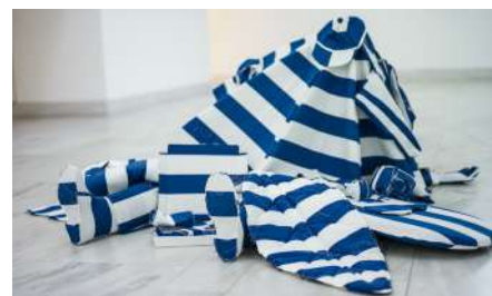
Pedro Valdez Cardoso, Untitled (LIFE), 2015 © Miguel Proença

Cette exposition se construit à partir de la polysémie du mot boîte : de nuit, entreprise, ou juste contenant. Imaginons que l'espace d'exposition de Treize soit cette boîte qui en contiendrait tous les sens.