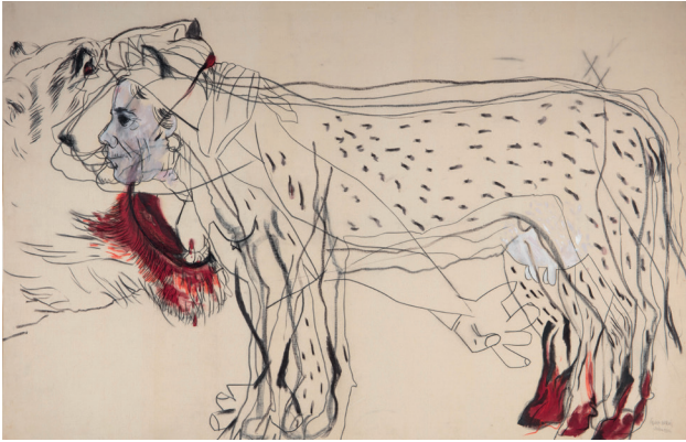
Graça Morais, Maria , 1982 Fusain et huile sur toile, 145 x 206, Collection de l'artiste, Crédit : © Graça Morais