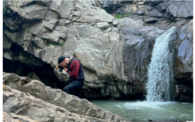
© Uriel Orlow, Forest Futurism, production image, 2022

du 20 mars 2024 au 30 mars 2024 à L'Île-Saint-Denis