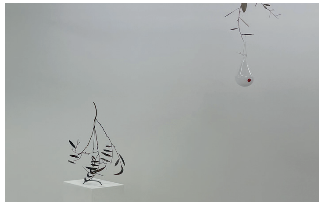
© Vue d'exposition, Friche la Belle de Mai, Francisco Tropa

du 18 novembre 2023 au 13 mai 2024 à Metz