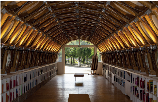
© Shigeru Ban Architects Europe et Jean de Gastines Architectes

du 31 août 2023 au 03 septembre 2023 à Marseille