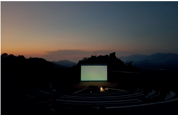
Screening in the edible amphitheater

du 29 juin 2024 au 22 septembre 2024 au Château de Voltaire à Ferney-Voltaire et au Fort l'Écluse