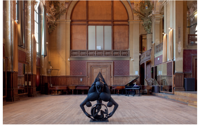
Vue d'installation, SYSTEMA, Palais Carli, 2022 © SYSTEMA

du 17 novembre 2023 au 20 mai 2024 à Paris