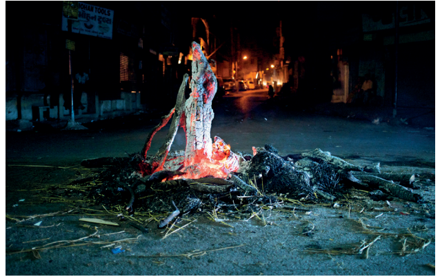
Feu, 2012

du 21 mars 2024 au 25 avril 2024 à Paris