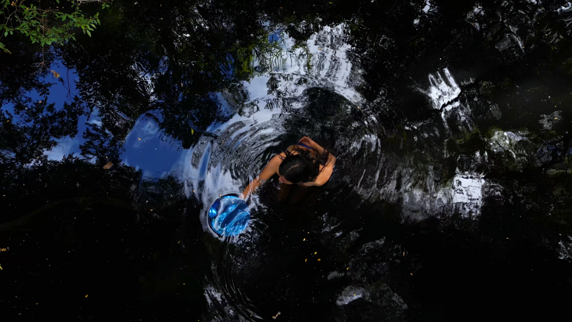
Seba Calfuqueo, Miroir d'eau (still), 2023.