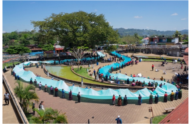
Regina José Galindo, Ríos de gente (still), 2021