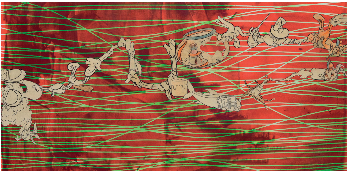
© Ana Vidigal, Não há como fugir do tempo, 2022. Courtesy de l'artiste

La Délégation en France de la Fondation Gulbenkian ouvre, du 15 janvier au 15 mars 2026, la 8 e édition de son appel à candidatures destiné aux projets d'expositions mettant en avant des artistes de la scène portugaise en Europe francophone. Désormais bi-annuel, cet appel se déroule en deux sessions chaque année : une première de janvier à mars et une seconde, de septembre à octobre.