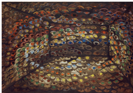
Maria Helena Vieira da Silva, La Scala ou Les yeux, 1937