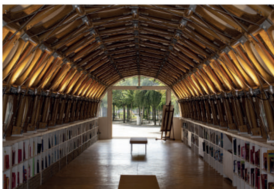
© Shigeru Ban Architects Europe et Jean de Gastines Architectes

« CROQUE-COULEUR » est la première exposition monographique d'envergure consacrée au peintre portugais José Loureiro en France. L'invitation de l'artiste peintre au Frac Grand Large annonce un brouillage complet des frontières entre abstraction et figuration. Les formes et les couleurs s'animent par la gravité et le mouvement.