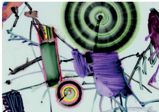
José Loureiro © ADAGP

La figure de Shéhérazade incarne dans cette exposition, les réflexions liées au mythe et à son potentiel de transformation sociale. Elle interroge le rôle de la fable comme force créatrice de nouveaux chemins individuels et collectifs.