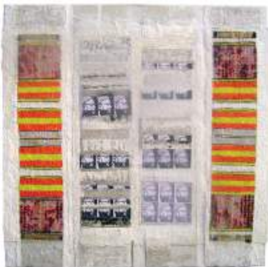
Manuela Jardim, Pano d'obra peinture acrylique sur papier tendu, 100 x 100 cm

Grâce à un dispositif solidaire, des bénéficiaires de l'association Aurore et des élèves du 14 e arrondissement de Paris participeront à des ateliers de co-création. Ces ateliers se dérouleront au sein de La Roche (ancien hôpital La Rochefoucauld), aujourd'hui transformé en lieu d'occupation temporaire porté par Plateau Urbain.