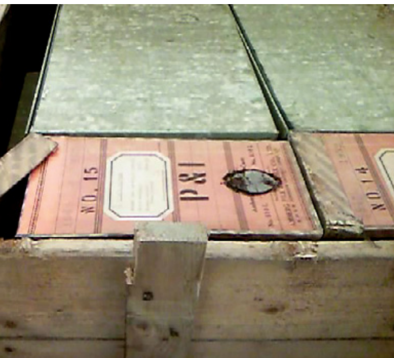
✦ Arquivo Calouste Gulbenkian proveniente de Londres: caixa com agendas pessoais do Fundador.

Integram este conjunto os seguintes arquivos: ex-Serviço do Ultramar, ex-Serviço de Cooperação com os Novos Estados Africanos, ex-Serviço de Cooperação para o Desenvolvimento e alguma documentação do Serviço Internacional. A dimensão destes arquivos era, à data do início do processamento documental, de 130,05 metros lineares.