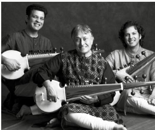
AMJAD ALI KHAN TRIO